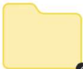
Материалы Дня единых действий (2021-2022)