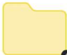
Материалы Дня единых действий 2023 г.

Видеоролик «Без срока давности», изготовленный в 2023 году, который дает определения понятий фашизма, нацизма, неонацизма и проводит прямую взаимосвязь событий Великой Отечественной войны и специальной военной операции, которую сегодня проводит Россия. И тогда, и сейчас мы останавливаем распространение фашизма и нацизма в мире